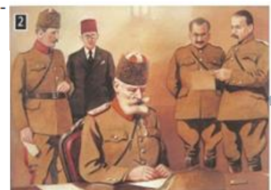
Ο Χασάν Ταχσίν Πασάς υπογράφει την παράδοση της Θεσσαλονίκης, υδατογραφία, συλλογή Δημοτικής Πινακοθήκης Θεσσαλονίκης