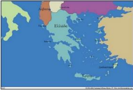
Η Ελλάδα μετά τη συνθήκη του Λονδίνου